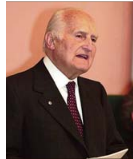
Oscar Luigi Scalfaro, presidente emerito della Repubblica e senatore a vita. È stato al Quirinale dal 1992 al 1999

più dicasteri, dalla Pubblica Istruzione alla Giustizia. Propose e varò riforme, si batté per la creazione del Consiglio superiore della Magistratura e dell'Ordine dei Giornalisti (di cui fu eletto primo presidente nel 1963), a garanzia delle rispettive autonomie professionali, nel segno della tutela dei cittadini. La figura di Gonella verrà ricordata a Roma