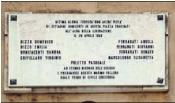
A sinistra, la lapide che ricorda a Pressana le vittime degli eccidi. I tedeschi dissero agli ostaggi: «Voi correre, noi sparare»