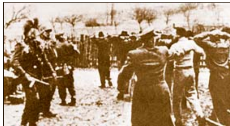
Tirare immagini di rappresaglie tedesche: a sinistra, una retata in Piemonte; a destra, fucilazione sul Monte Grappa. Nell'ultima foto a destra, la contrada Croce di Vestena incendiata